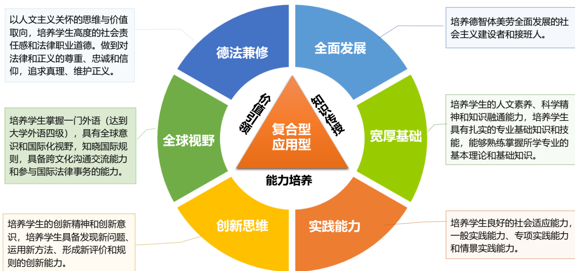
图1 本科人才培养目标核心素质能力体系